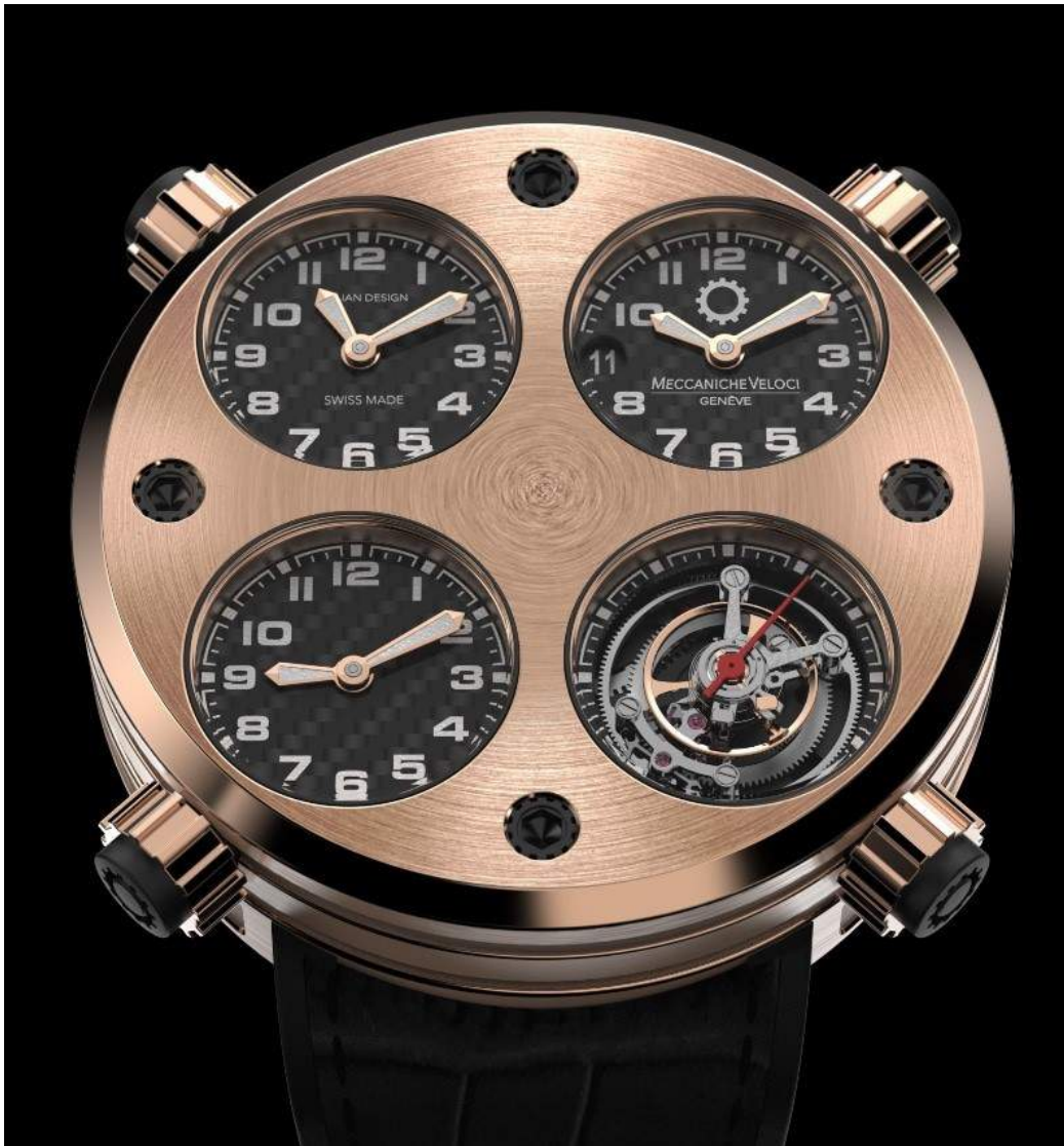
Meccaniche Veloci Quattrovalvole Tourbillon

RS : Les noms de la marque et de la collection “QuattroValvole” évoquent les Ferrari et Lamborghini des années 1980 (328, Countach...). Est-ce-que ce sont des voitures qui vous ont fait vibrer dans votre jeunesse ?