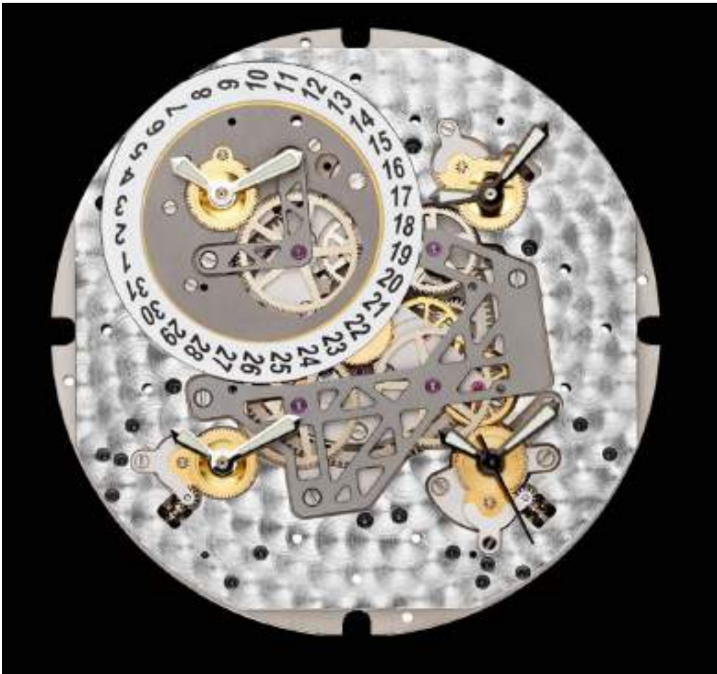
Calibre MV 8802