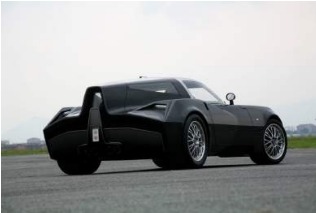
Spada Vettore Sport Codatronca T-S