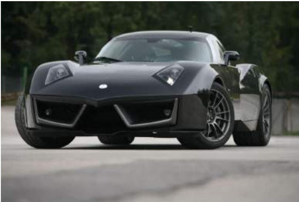
Spada Vettore Sport Codatronca T-S