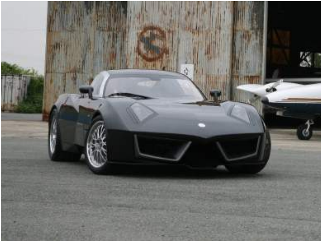
Spada Vettore Sport Codatronca T-S