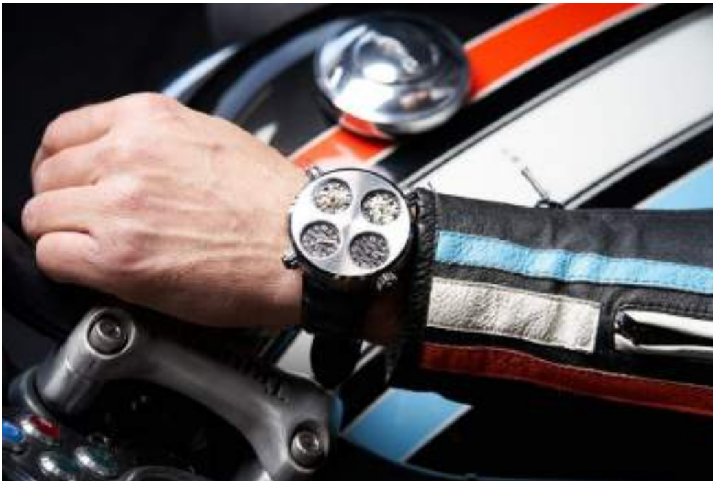
Meccaniche Veloci Icon Mud