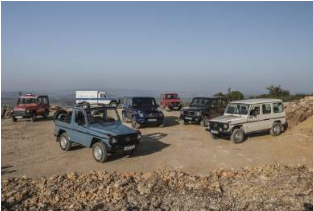
Mercedes-Benz Classe G