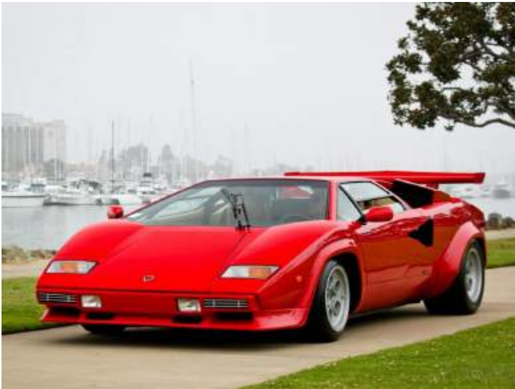
Lamborghini Countach 5000 QV

RS : Quelle est la gamme de prix des deux collections “QuattroValvole” et “Icon” ? Quels sont les modèles qui se vendent le mieux ?