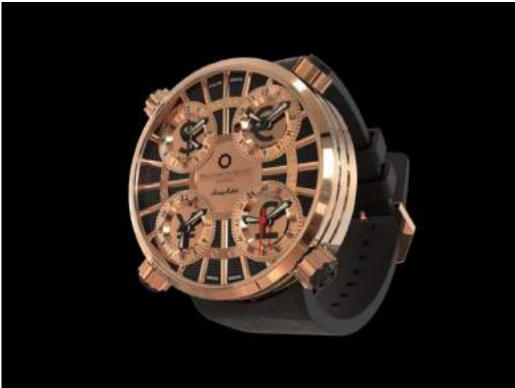
Meccaniche QuattroValvole MoneyMaker Gold