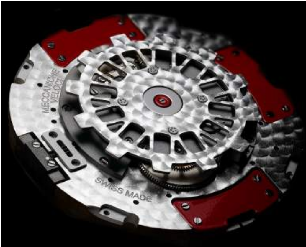
Calibre MV 8802

RS : Toutes les montres Meccaniche Veloci ont des boîtiers imposants de 49 mm très masculins. N'est-ce pas une gêne à la vente ? Comptez-vous faire des modèles plus petits pour ceux qui ont des petits poignets et une gamme féminine ?