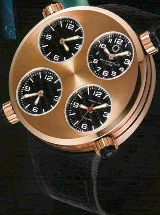
アイコン/380万円(予価)