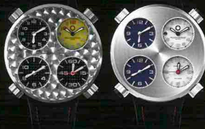
アイコン/各88万円(予価)

フェイスに4つのインダイヤルを配し、それぞれが独立した時間を表示。クォーツ式のように、実はひとつの機械式ムーブメントからリンクします。この機構を共同開発したのは、多くのコンプリケーションを手がけるスイスのR&D専門会社のテロス社。リッチなPGからも本気度が漂います。自動巻き、18KPGケース(49mm)、レザーストラップ。厚さ14.6mm。/メカニケ・ヴェローチ(ロングスロウディスタンス東京)